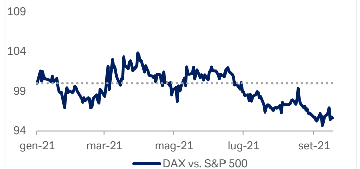
Grafico 2: Indici a confronto: DAX e S&P 500

Fonte: Bloomberg Finance L.P., Deutsche Bank AG. 17 settembre 2021